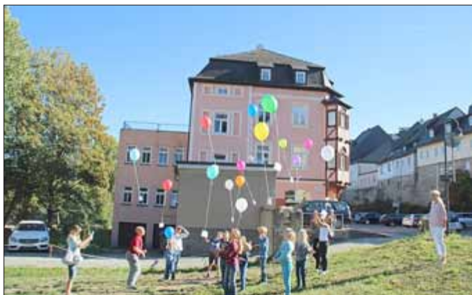
Die bunten Ballons steigen vor dem Diakonieladen in den Himmel